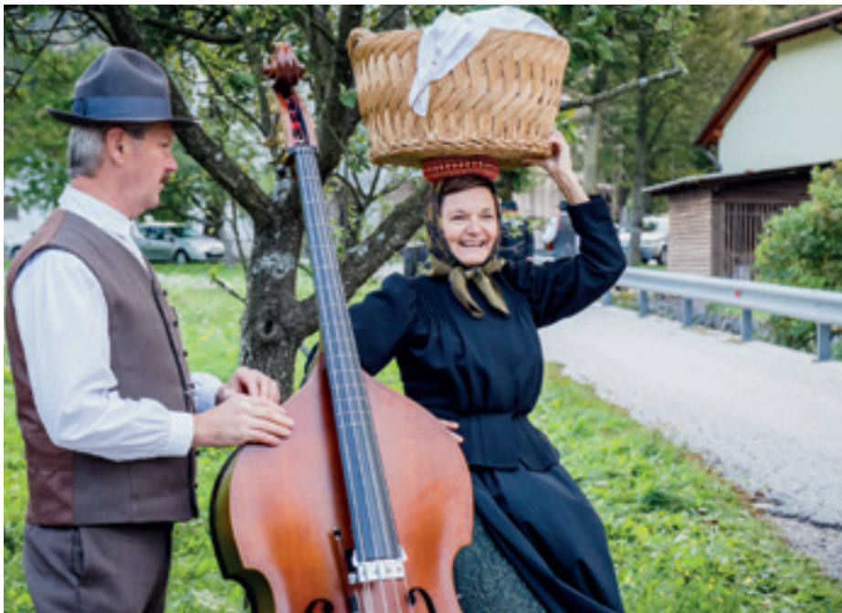
Volksmusik und -tanz aus Kal nad Kanalom, Slowenien.