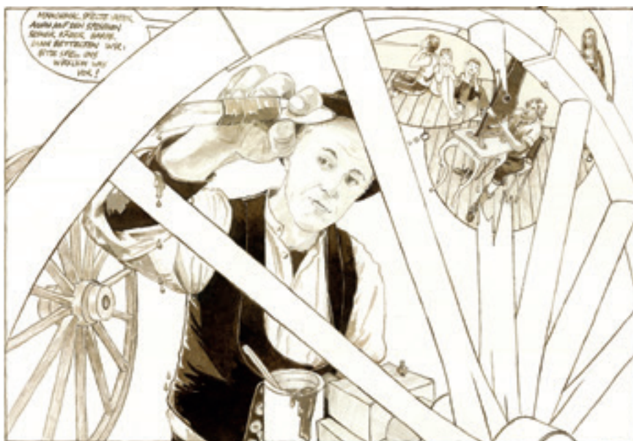
Graphic Novel Horst Stein. www.horststein.eu

Comics sind keine reine Kindersache. Dies lässt sich an Verlagsprogrammen ablesen, aber auch am internationalen Ausstellungskalender – wie Comicausstellungen in Linz, Wien und Niederösterreich zeigen.