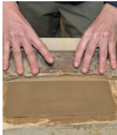
... und abgezogen.

„Diese Kalkanreicherung kann man in Hohlwegen als Form sogenannter Lößkindl sehen“, so der Ofensetzer. „Der Kalk lagert sich vorzugsweise um Steine ab und nimmt die Form eines Kindes oder einer Puppe an.“ Belohnt wird die geduldige Arbeit mit Kacheln in sanften Rot- und Brauntönen. Gerold Wucherer presst den Löß in Modeln und belässt die Kacheln unglasiert. Gebrannt werden die Lößkacheln bei 1.120 °C. Diese setzt er abgestuft auf den Ofen, „das ist meine Reverenz an die Terrassenlandschaft der Region.“