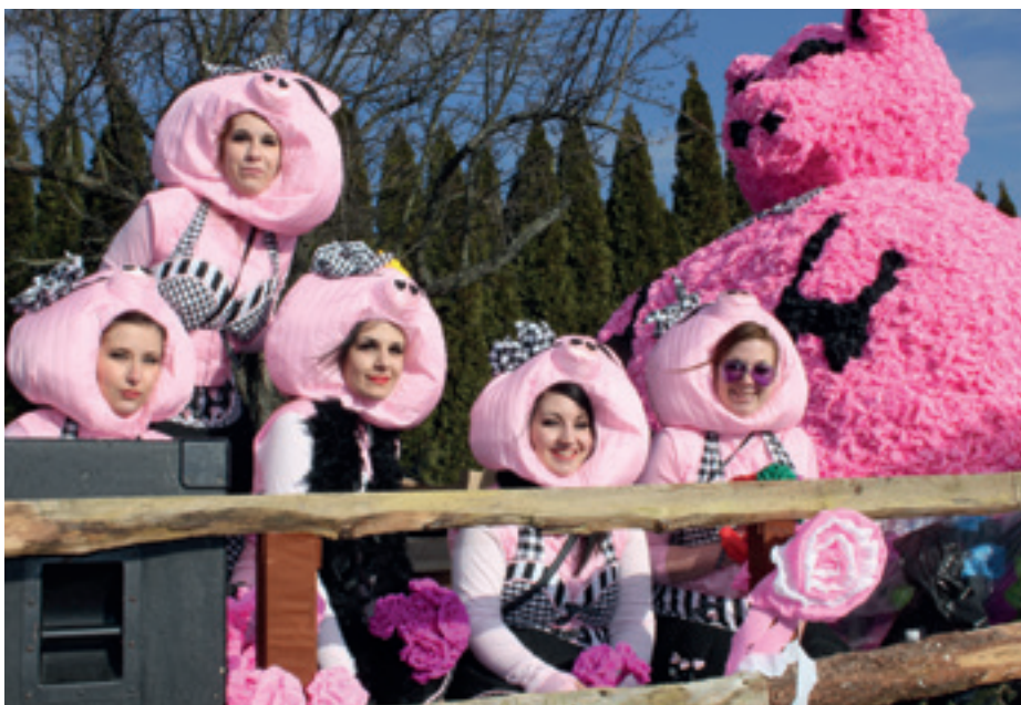
Den Ideen und Vorstellungen der Faschingswägen in Lichtenwörth sind keine Grenzen gesetzt ...