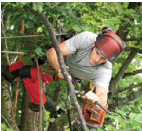
Traditionelle Baumpflege ...