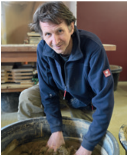
Löß wird geknetet ...