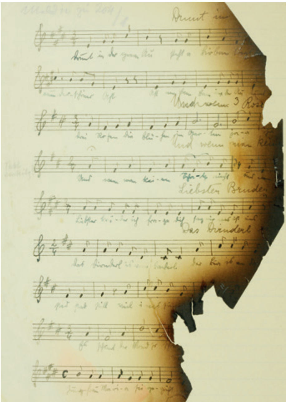
Original der Aufzeichnung von Ada Nogger aus Oberschoderlee, 1945 teilweise zerstört, NÖ Volksliedarchiv.

Frauen in der frühen Volksmusikforschung. Während in den Ausschüssen des Österreichischen Volksliedunternehmens ausnahmslos Männer saßen, haben Frauen im hohen Maße Lieder und Tänze gesammelt.