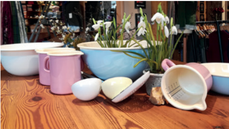
In neunter Generation wird Kochgeschirr in Ybbsitz im Mostviertel produziert. Seit 1922 hat sich Riess auf die Herstellung von Emailtöpfen spezialisiert. Ein Klassiker ist das Emailgeschirr in Pastelltönen.