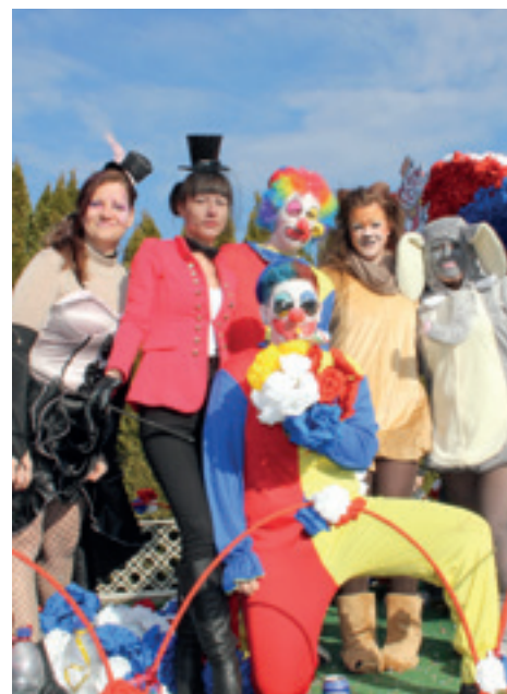
... – grell und bunt.

Seit mittlerweile 155 Jahren gibt es den Faschingsumzug in Lichtenwörth. Lediglich im Zweiten Weltkrieg und während der Maul- und Klauenseuche 1973 gab es Unterbrechungen. In vielen Gemeinden mit überwiegend in der Landwirtschaft tätiger Bevölkerung war und ist es üblich, nach Weihnachten eine Ruhepause einzulegen. Diese wurde dazu genutzt, um unter anderem auch zu feiern.