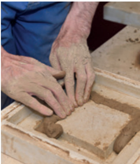
... in eine Model gepresst ...