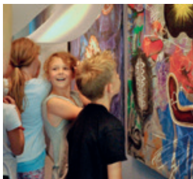
Kunstmuseum Schrems.

Fr, 4. 5. 2018 TAG DER MUSIKSCHULEN Motto: Musik macht Freu(n)de Landesweit