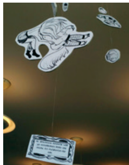
Maggie und Arnold und die SpaceTimeNow-Lotterie, 2017, ARTSGalerie im Konzerthaus Weinviertel. Idee: Eggy / Zeichnung: Jacky. Foto: privat

Seit 1971 hat der Comic als Neunte Kunst einen Eintrag in der französischen Enzyklopädie „Grande Encyclopédie Alfabétique Larousse“. Comics und verwandte Formen graphischer Erzählungen existieren aber nicht nur in Heft- und Buchform, sondern erobern auch die Ausstellungswelt. Erstmals ausstellungswürdig wurden Comics spätestens in den 1930er-Jahren – Vorreiter waren hier die USA. Seither wird international in Ausstellungen der Facettenreichtum der Neunten Kunst aufgezeigt. Und seit mindestens zehn Jahren kann man hier getrost ergänzen: gerade auch in Österreich!