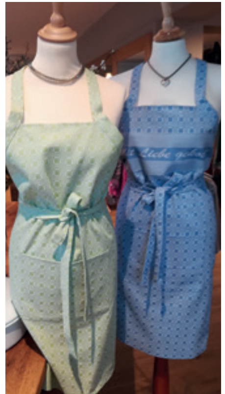
Küchenwäsche der Weberei Kitzmüller ist strapazierbar und saugfähig. Mit den Schürzen der Mühlviertler Weberei ist jede Küchenschlacht zu gewinnen.