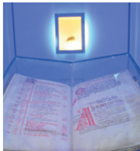
Abschrift der Ordensregel, 14. Jahrhundert.

Christi. In der Vorstellung des mittelalterlichen Menschen versinnbildlichte dieser Gnadenschatz eine besondere Nähe zum Heilsgeschehen. Das sogenannte Melker Kreuz gehört bis heute zu den größten Kostbarkeiten des Hauses. Es ist nicht nur ein Kunstobjekt, sondern auch ein Objekt der Verehrung. Wer das Stift besucht, ist also nicht nur eingeladen, die künstlerische Schönheit der ausgestellten Schätze zu genießen, sondern auch dem religiösen Geist, der dahintersteht, zu begegnen.