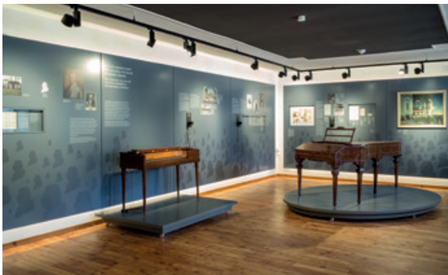
Wohnstube im Haydn Geburtshaus Rohrau – die Tätigkeiten der Eltern (Wagner und Schlossköchin) werden hier vorgestellt.

Güldenfuß. 2018 ist dort die Berliner Künstlerin Moki zu Gast, die schon vor Antritt des Aufenthaltsstipendiums des Landes Niederösterreich durch die Gestaltung des Sujets für das diesjährige NEXTCOMIC-Festival präsent ist.