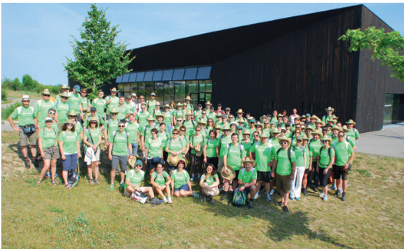
Betriebsausflug des Teams vom Maschinenring ins Museumsdorf Niedersulz.

Vor zehn Jahren initiierte die Volkskultur Niederösterreich „Wir tragen Niederösterreich“ – eine Plattform für die vielen positiven Aspekte des Bundeslandes. Anlässlich des Jubiläums porträtiert Schaufenster Kultur.Region die Partnerinstitutionen in loser Serie.