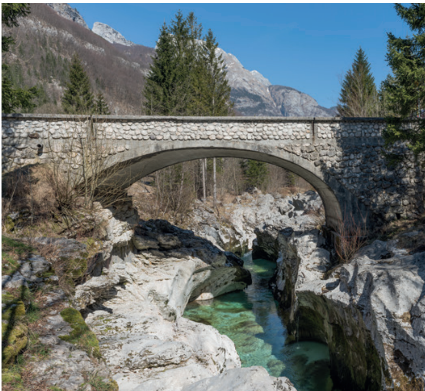
Brücke über die Soča (Isonzo).

Die musikalische Reise im Haus der Regionen beginnt in Slowenien, macht einen Abstecher ins Waldviertel, heißt burgenlandkroatische Tamburizzaspieler willkommen und führt bis nach Südtirol.