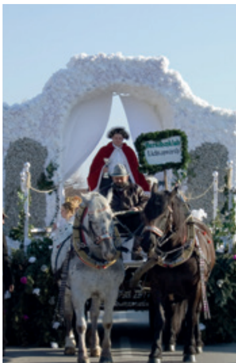
Der Faschingsumzug wird traditionell von Prinz Karneval und seinen Prinzessinnen eröffnet.