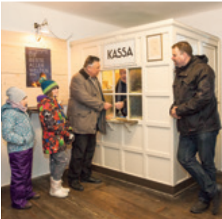
Lichtspiele Gföhl: nostalgisches Kassabüschchen ...