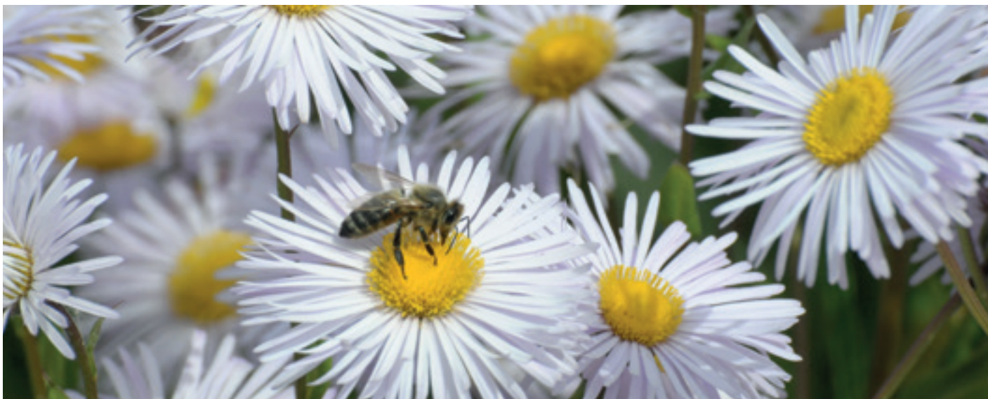
Summ, summ, summ ...

Sie sind eines der wichtigsten Nutztiere der Welt. Dem Thema Bienen sind 2018 im Museumsdorf Thementage gewidmet.