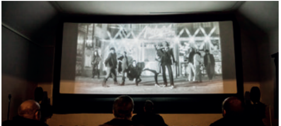
... und Filmklassiker auf der Leinwand.