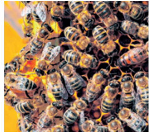
Königin mit Hofstaat.

zwischen Flora und Fauna, die bereits seit über 200 Millionen Jahren besteht. Zwar fungieren neben der großen Spezies der Insekten mit hunderten Schmetterlings-, Fliegen- und Käferarten auch Vögel und Fledermäuse als Bestäuber und Verbreiter von Pollen, allerdings ist keine Tiergattung so fleißig wie die Biene, die für die Bestäubung von 80 Prozent aller Nutzpflanzen der Gärten, Wiesen und Äcker verantwortlich sind. Sie sorgen dafür, dass die für uns Menschen so wichtigen Arten der Obstsorten wie Äpfel, Birnen etc., die meisten Beerenarten, Kürbisse und Gewürzkräuter, Raps sowie Wild- und Gartenblumen bestäubt werden. Biodiversität ist dabei das Schlagwort, denn die Vielfalt der Ökosysteme und deren Wechselwirkung zueinander ist auch für die Bienen die Garantie für ihren Fortbestand. In zu artenarmen Wiesen und Gärten verhungern sie schlicht und einfach, denn für ein halbes Kilo Honig muss eine einzige Biene in etwa drei Millionen Blüten anfliegen. Die kleinen Insekten leisten dabei unvorstellbar Großes, denn eine Biene fliegt pro Tag 40 Mal aus und besucht pro Ausflug rund 100 Blüten. Rechnet man hoch, ergibt sich bei einem Bienenvolk mit 10.000 Flugbienen damit eine Summe von rund 40 Millionen besuchter Blüten pro Tag.