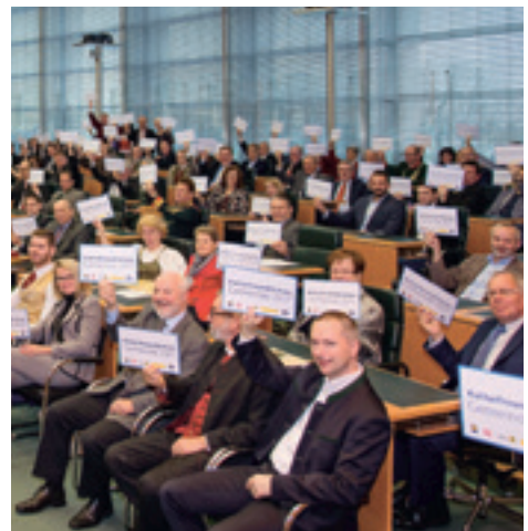
Bürgermeister der ausgezeichneten Gemeinden mit ihren Vor-Ort-Delegationen im Landtagssaal in St. Pölten.