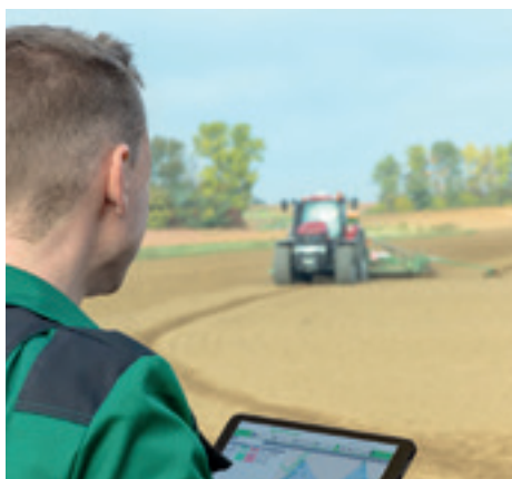
... und „Precision Farming“ mit Maschinenring 4.0.