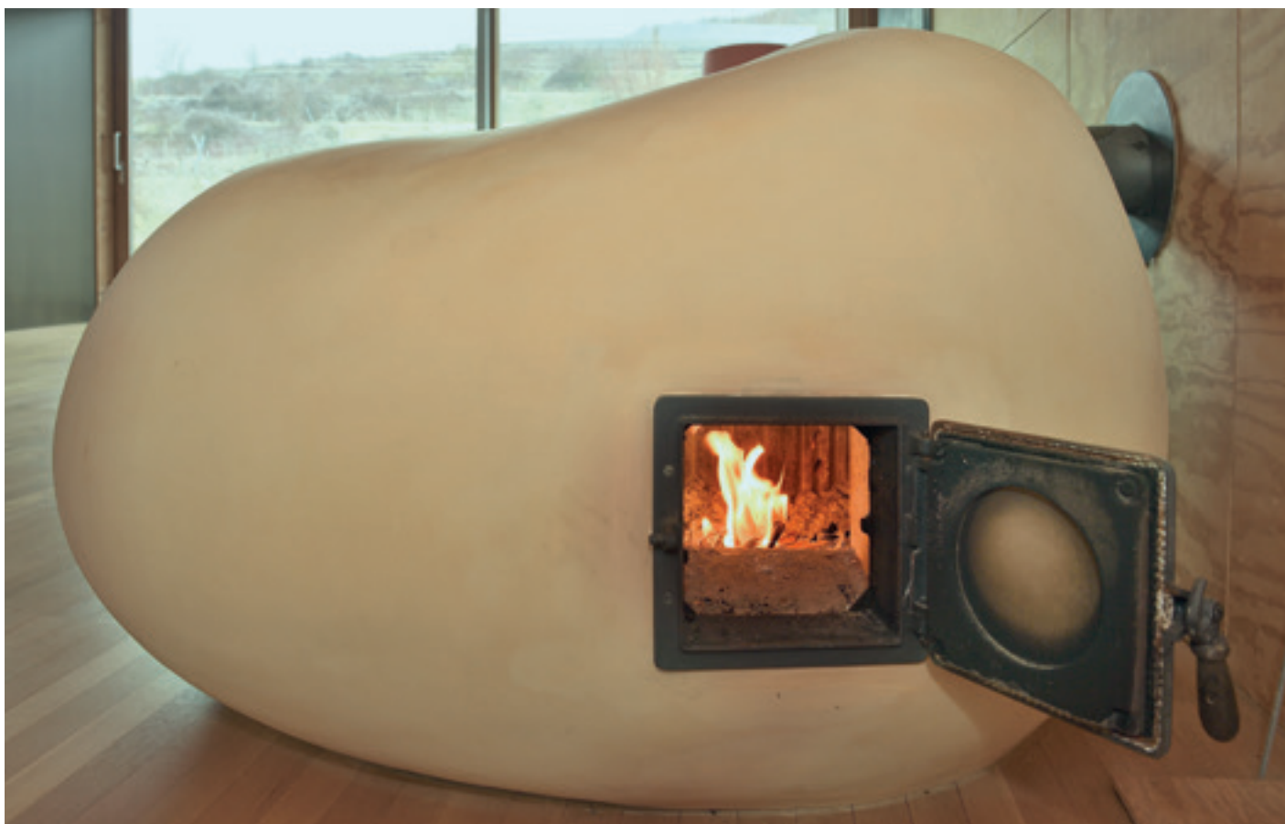
Raumskulpturen, die warm halten.

Wohlige Wärme und zeitgemäße Formen – das vereinen die Kachelöfen des Keramikers Gerold Wucherer. Ein Werkstattbesuch.