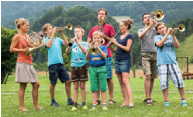
Gemeinsam musizieren, singen und tanzen.

2018 geht die Musikantenwoche mit einem neuen Termin an den Start: Erstmals findet die Seminarwoche in der dritten Augustwoche statt. Als abschließendes Highlight des Sommers wird dann im malerischen Ambiente der Landwirtschaftlichen Fachschule Unterleiten wieder eine Woche lang gemeinsam musiziert, gesungen und getanzt. Dabei liegt der Fokus auf dem gemeinsamen Spiel im Ensemble, wobei viel auswendig gespielt und ein natürlicher Zugang zur Musik gesucht wird. Das vielfältige Angebot der Seminarwoche richtet sich an Geiger, Harmonika- und Hackbrettspieler, Blechbläser sowie an Sänger und Volkstänzer. Angesprochen sind Tanz-, Gesang- und Musikbegeisterte aller Altersgruppen, die Freude am gemeinsamen Musizieren im Ensemble haben. /