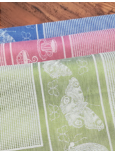
Reiches und buntes Sortiment an Geschirrtüchern in Baumwoll- und Halbleinenqualität aus österreichischen Webereien.