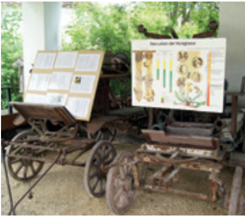
Bienen-Thementage im Museumsdorf.