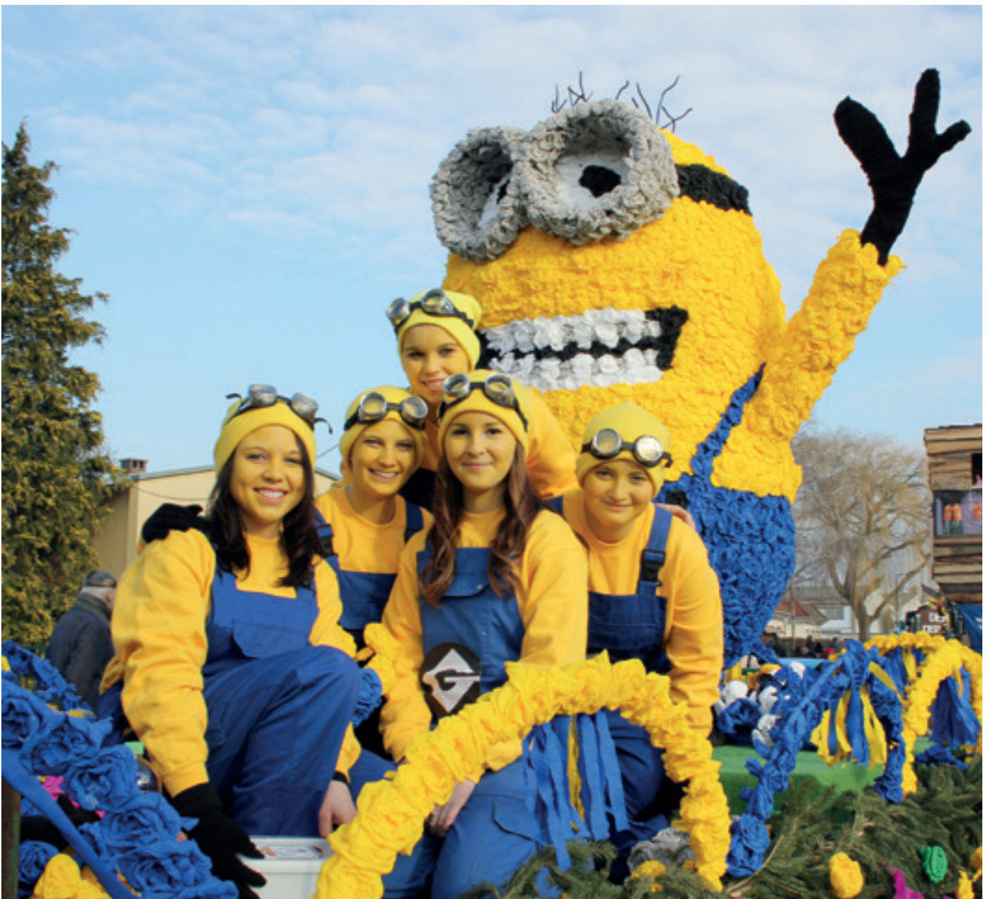
Der US-amerikanische 3D-Animationsfilm „Minions“ war bereits 2015 vertreten.

Mit rund 2.700 Einwohnern hat Lichtenwörth im südlichen Niederösterreich etwas Einzigartiges zu bieten – den legendären Umzug am Faschingssonntag.