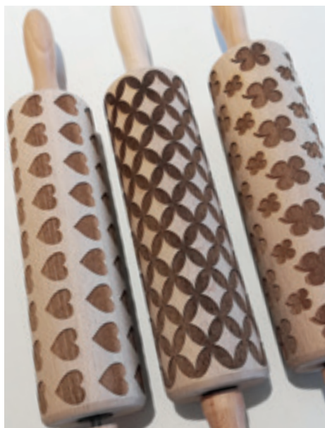
Nudelwalker mit Pepp: Er macht fröhliche Muster und ist auch für Tortenglasuren einsetzbar sowie zum Handwerken mit Wachs oder Keramik.