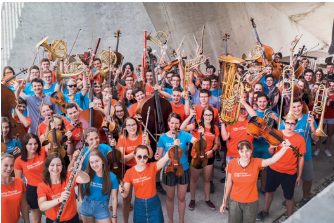
Große Bühne Wolkenturm, Grafenegg.

„Ein Leben ohne Jugendorchester ist möglich, aber sinnlos“ – frei nach Loriot.