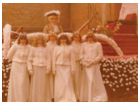
Prinz Karneval mit seinen sechs Prinzessinnen, 1979.

geschildert, die im Laufe des Jahres im Ort passiert sind, sodass jeder Leser weiß, auf welche Personen und Ereignisse beim Umzug Bezug genommen wird. In den 1950er-Jahren wurden die verschiedenen Geschichten noch aufwendig in Reimform gedichtet, mittlerweile ist die Faschingszeitung wie eine moderne Zeitung aufgebaut.