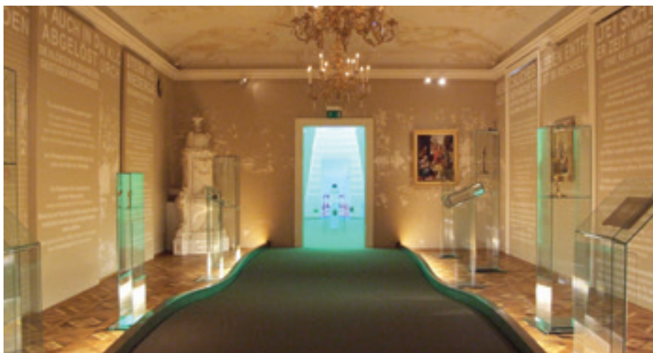
Einblick in die Ausstellung des Stifts Melk.