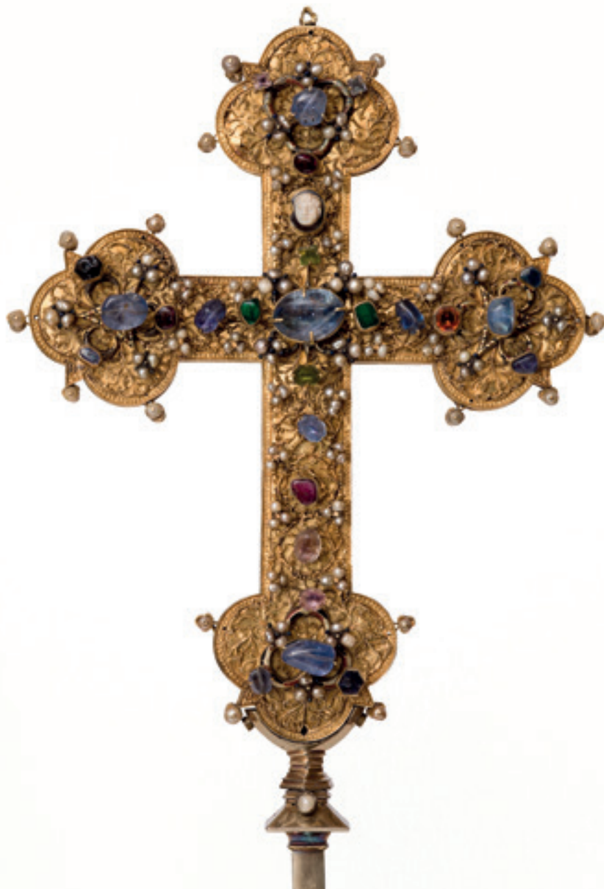
Kostbarkeit der Stiftssammlung: das Melker Kreuz.

Die niederösterreichischen Stifte ziehen jedes Jahr Kulturbegiertere aus aller Welt an.