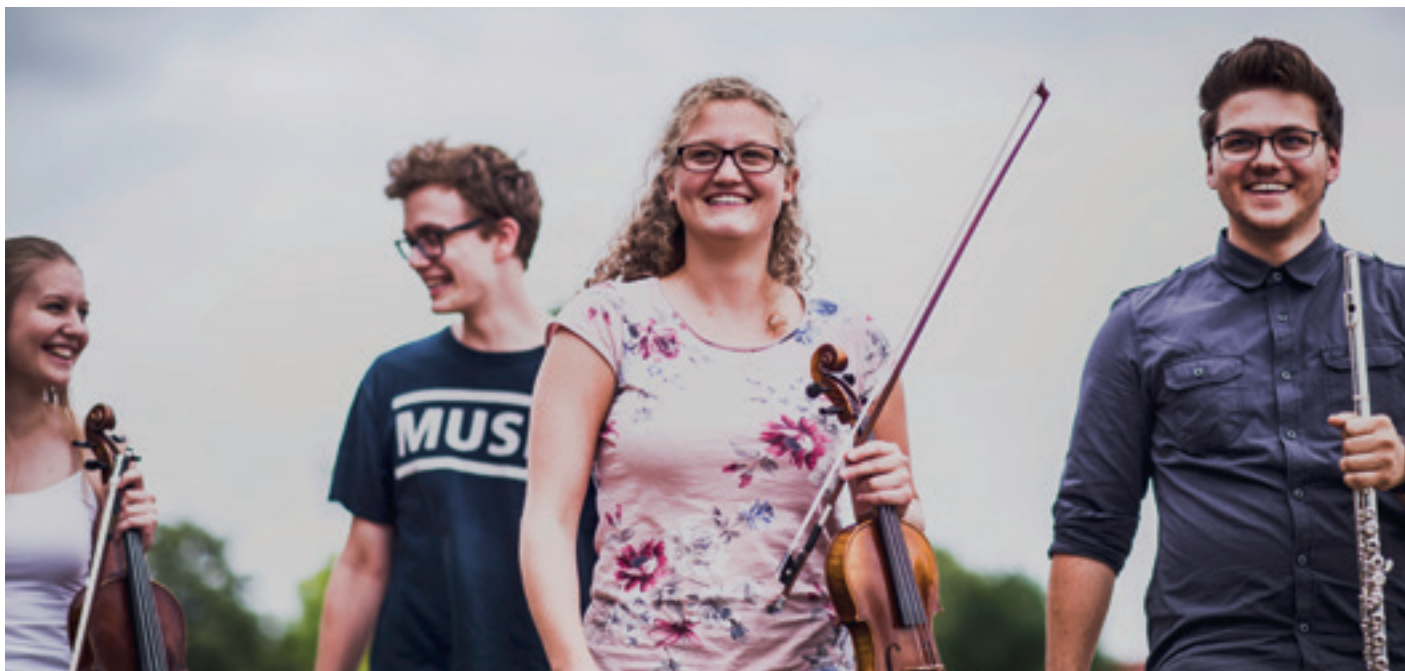
Jugendsinfonieorchester NÖ: Jungen Talenten die Möglichkeiten bieten, gemeinsam zu musizieren und die Welt der sinfonischen Orchestermusik kennenzulernen.

des jungen Orchesters, welches ein Vorzeigeprojekt im Bereich der Talentförderung ist, obliegt dem Musikschulmanagement Niederösterreich.