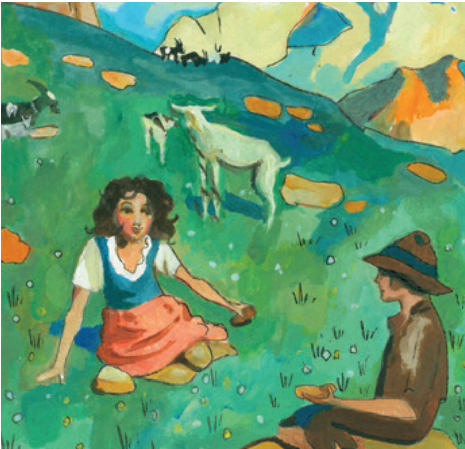
Heidi – der Roman von Johanna Spyri wurde in 50 Sprachen übersetzt, verfilmt, als Comics verarbeitet und wird im Herbst als Musical in Wien auf die Bühne gebracht.

Das Leben auf der Alm wird mit Romantik und heiler Natur verbunden. Dabei war die Bewirtschaftung der Almen schon im 19. Jahrhundert gefährdet und wurde durch Schutzmaßnahmen gefördert.