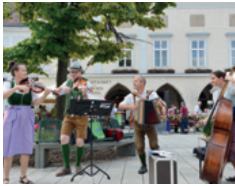
Musik auf allen Plätzen: Hier die Anzenbacher Tanzgeiger bei der Straßenmusik.