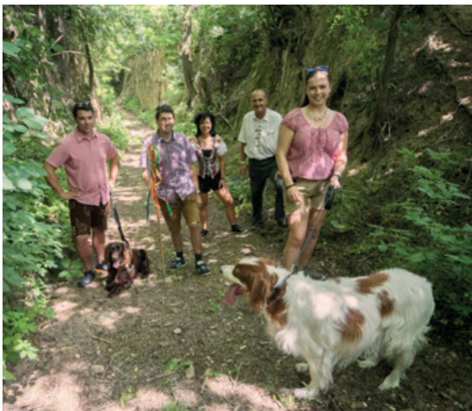
Geführte Hohlwegwanderung in Radlbrunn.

Hohlwege sind eine faszinierende Kulturlandschaft, deren Grundlage die Erosion eiszeitlicher Sandverfrachtungen bildet. Hohlwegwanderungen bringen uns nicht nur Geologie, Flora und Fauna näher – sie helfen auch, diese zu erhalten.