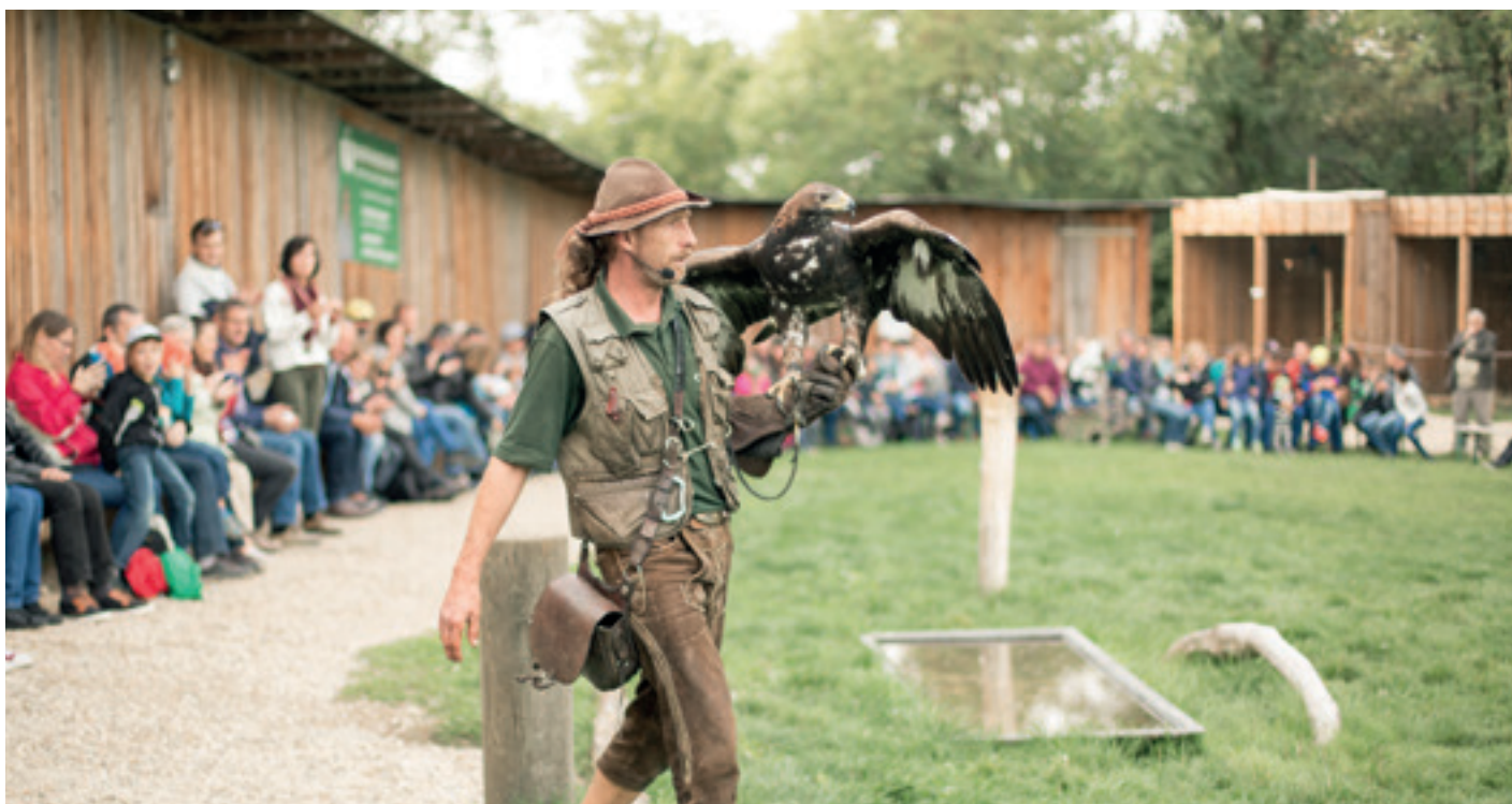
Bereit zur Flugvorführung am Heldenberg.

„Vom Schaf zum Pullover“ und „Leben wie die Fürsten“: Bei vielfältigen Vermittlungsangeboten in Niederösterreichs Museen und Bastelworkshops im Museumsdorf Niedersulz tauchen Kinder in frühere Zeiten ein, haben Spaß und lernen Neues.