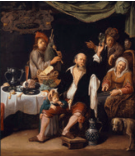
David Ryckaert III., „Fröhliche Gesellschaft“, vor 1650, Museum der schönen Künste, Budapest.

Singen im Dreißigjährigen Krieg (1618–1648) – eine Spurensuche.