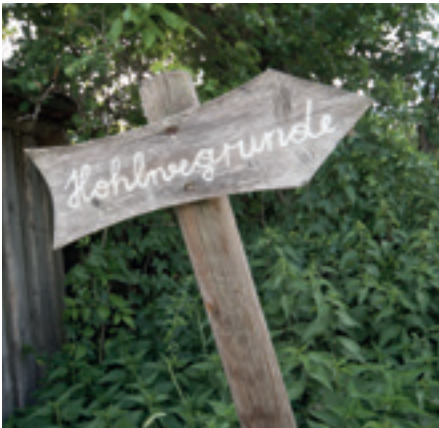
Niederösterreichs Hohlwegwanderwege laden zu Erkundungen ein.