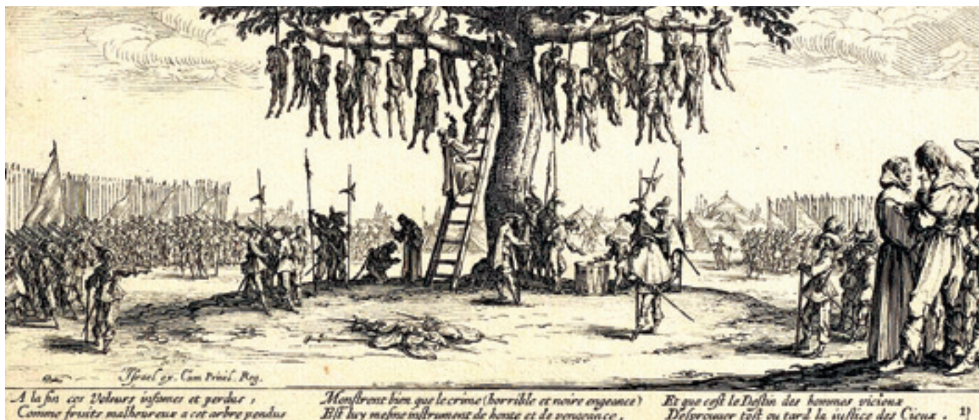
Jacques Callot (1592–1635) hat mit seinem Radierzyklus „Die großen Schrecken des Krieges“ ein zeitloses Kunstwerk geschaffen, das Bilder des Dreißigjährigen Krieges evokiert.

die zwischen 1611 und 1613 in der „Linzer Orgeltabulatur“ veröffentlicht worden war.