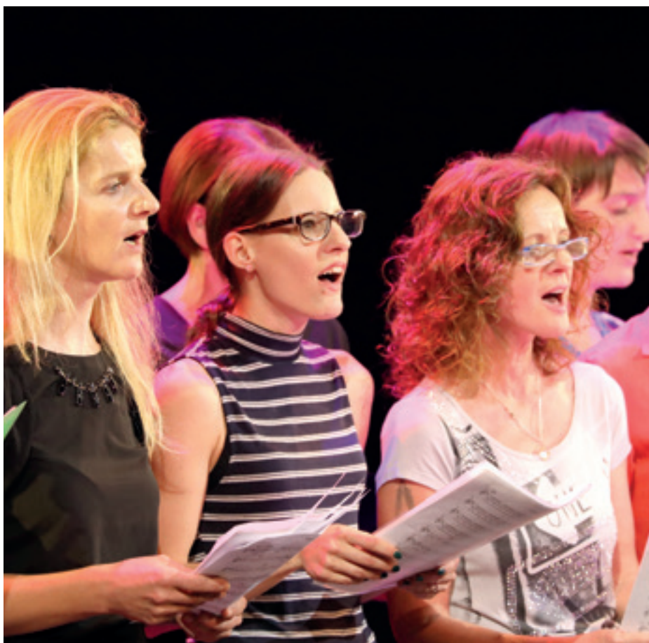
Das offene Konzept und die vielen eigenen Arrangements zeichnen das Community-Projekt Welt.Chor aus.

Der Community-Gedanke liegt auch dem jüngsten Vermittlungsangebot des Festspielhauses zugrunde: Spaß & Wellness für die Stimme – unabhängig von Hautfarbe und Muttersprache.