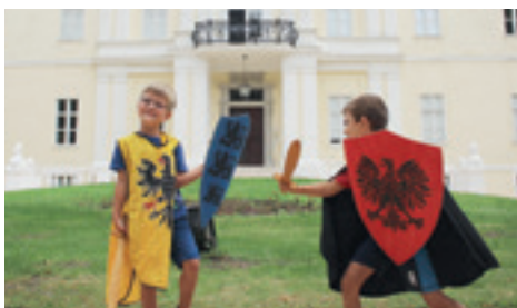
Ritterturnier im Liechtenstein-Schloss Wilfersdorf.