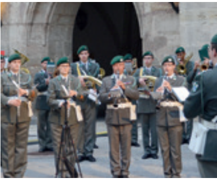
An die 200 Auftritte pro Jahr absolvieren die Musiker der Militärmusik Niederösterreich.