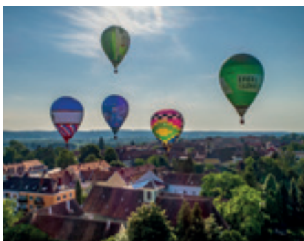
... folgt die Fahrt über Städte ...