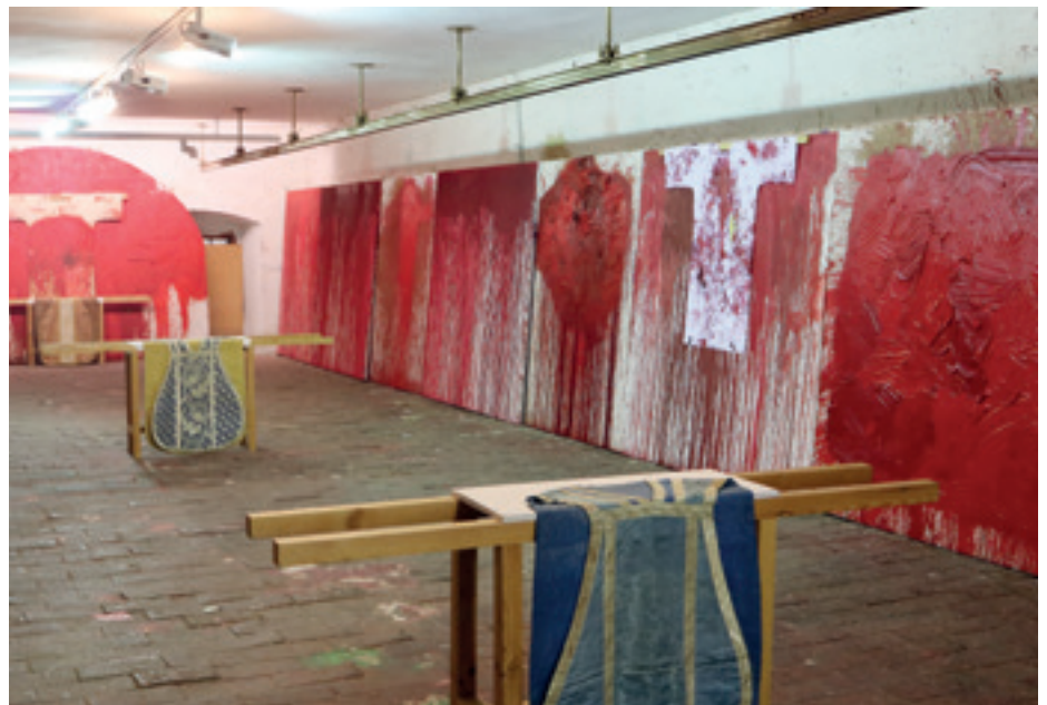
Atelier am Schüttboden im Schloss Prinzensdorf.

Nitsch: Ich bin dafür, dass sich Kunst nicht nur in Großstädten ereignen soll. Im