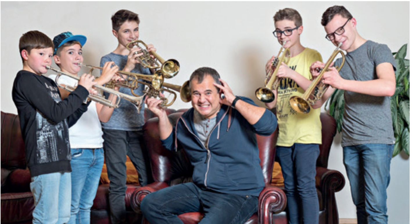
Der Ohrwurm – präsentiert von der Musikschule Bad Vöslau.