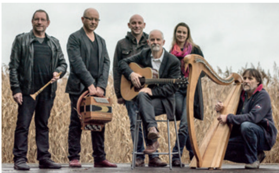
Die keltische Harfe der bretonischen Gruppe Dremmwel.

Von der Bretagne nach Südungarn, vom Landler zum Wiener Naschmarkt, von der Weltmusik bis nach „Good Old Europe“: Das Musikprogramm im Haus der Regionen versprüht Lebensfreude.