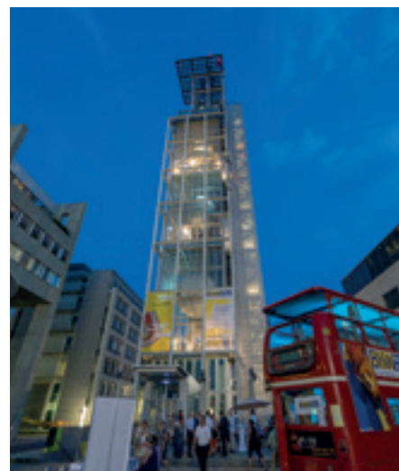
... Bildungsleuchtturm, dem Klangturm St. Pölten.

ereignisreichen Menschheitsgeschichte sind wir ihrer Meinung nach in der besten aller Welten angelangt. Leider aber als homo sapiens martialis, also als von Besitz und Habgier geleitete Menschheit. Zu verdanken haben wir das dem Neoliberalismus. Sie appellierte in ihrem Referat für das Bild eines neuen Menschen, nämlich des homo sapiens socialis. Besonders auch bei der Erziehung unserer Kinder, denn sonst werden wir nur noch Tyrannen heranziehen und die Bestie Mensch damit herauf beschwören. Sie hält die Bildung, auch die Herzensbildung für den einzigen gangbaren Weg: „Bildung, verstanden als kontinuierlichen Entwicklungsprozess eines humanistischen Betriebssystems jedes Kindes, ist das Wachstumshormon der Seele!“ Dafür braucht es ihrer Meinung nach ein Zusammenwirken aller Kräfte, die Kinder erziehen. Leibovici-Mühlberger: „Bildung ist ein komplexer, von uns allen zu tragender und zu verantwortender Prozess. Noch nie war das Thema Bildung so wichtig gewesen wie heute.“