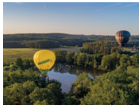
... und Teichlandschaften.

überlebten, ließ König Ludwig XVI. den Versuch mit Menschen zu.