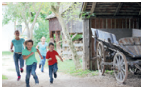
Museumsdorf Niedersulz – das Dorf für die ganze Familie.