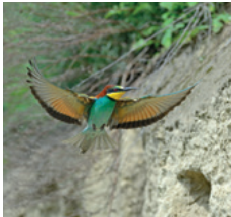
Amazonische Farbenpracht des Bienenfressers.