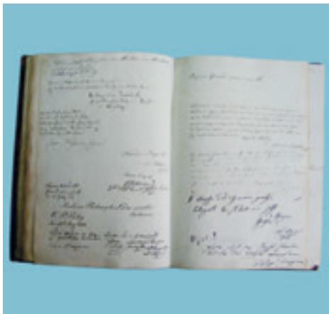
Eine Doppelseite aus dem Gästebuch Anton Rolletts (1778–1842), des Gründers der Sammlungen des Städtischen Rollett-Museums in Baden. Auf der rechten unteren Seite befindet sich eine kleine musikalische Widmung in Form eines Tusches.