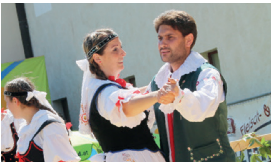
Folkloregruppe Javor aus dem südböhmischen Lomnice nad Lužnicí.

Das alljährliche Waldviertler Volkstanzfest ist am 15. Juli in Waldkirchen an der Thaya zu Gast.