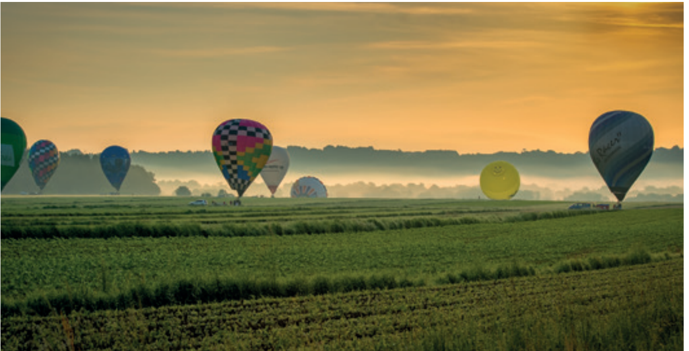
Ballone aus aller Welt im Waldviertel.

Bei der Weltmeisterschaft der Heißluftballone, die im August in Groß-Siegharts ausgetragen wird, haben Teams aus 35 Nationen die Gelegenheit, das Waldviertel von oben zu sehen – und die Zuseher freuen sich auf ein farbenfrohes Spektakel im sommerlichen Luftmeer.