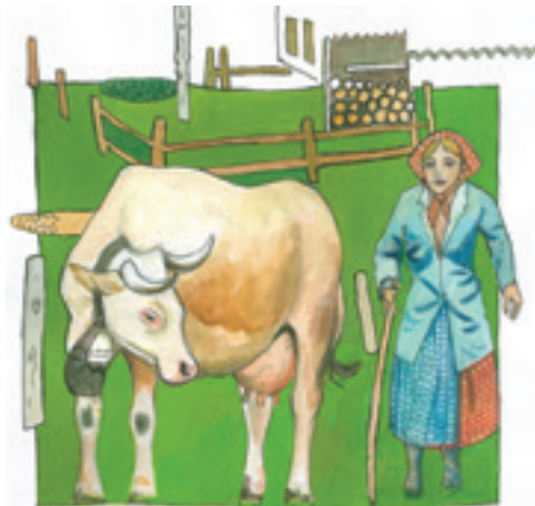
Schwoagrין, Sennerin, Almdirn oder Brentlerin sind regionale Bezeichnungen für Frauen, die Almen bewirtschaften.

Die Sennerin hatte zu den Tieren eine besondere Beziehung. Sie sprach mit ihnen, gab ihnen Namen und kannte jedes Rind. Sie hielt auch Ziegen und Schweine auf der Alm. Der Arbeitstag begann um zwei Uhr früh mit dem Melken, dann kam das Butterrühren. Der Stolz der Sennerin war „der schöne Butter“, am besten vom Futter gelb gefärbt und dann geformt und verziert. Die bis zu acht Kilogramm schweren Butterstrie-