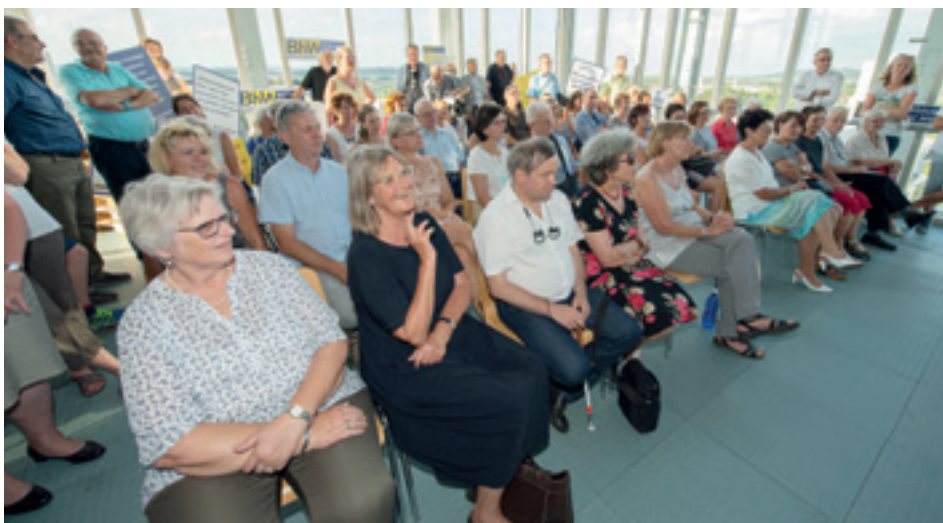
Die „Bildungshungrigen“ lauschten den Referaten im ...