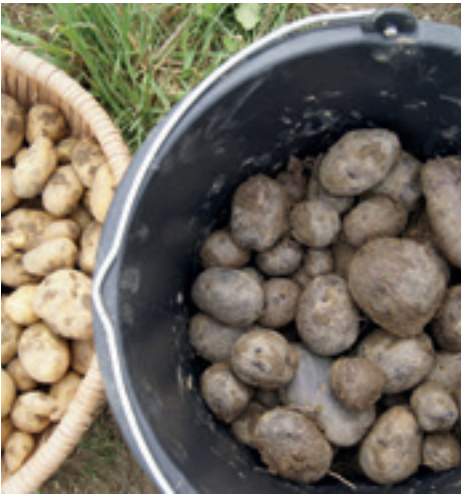
Sorten aus dem Museumsdorf: Vielfalt wird heute wieder geschätzt.