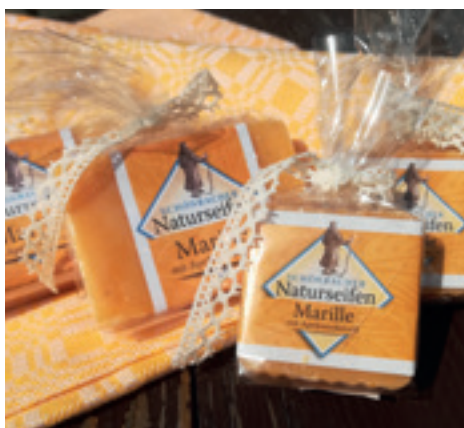
Schönbacher Naturseife wird im Waldviertel in sorgfältiger Handarbeit produziert. Hergestellt aus tierischen und pflanzlichen Fetten, welche zu 90 % aus der Region Waldviertel kommen. Ätherische Pflanzenöle – in diesem Fall Marillenkernöl – werden beigegeben.