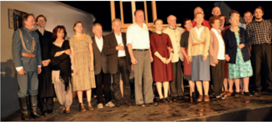
Die Bühne Weinviertel spielte „Jägerstätter“ von Felix Mitterer (6. v. l.) im Brandlhof, 2014.