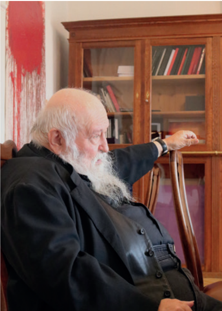
„Wahlweinviertel“ Hermann Nitsch lebt schon seit 1971 auf Schloss Prinzendorf im Weinviertel.

Anlässlich des 80. Geburtstags von Hermann Nitsch besuchte das Schaufenster Kultur.Region den Künstler in Schloss Prinzendorf. Ein Interview über das Alter, das Betrachten von Kunst, das Weinviertel und den Wein sowie Rituale.