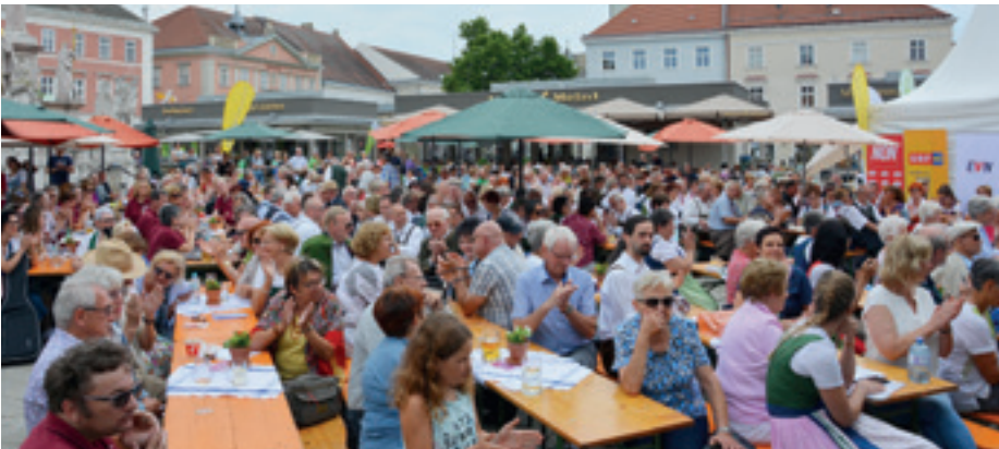
12.000 Besucher erlebten ein Volkskulturfestival unter dem Motto „Dialog zwischen Stadt und Land“.