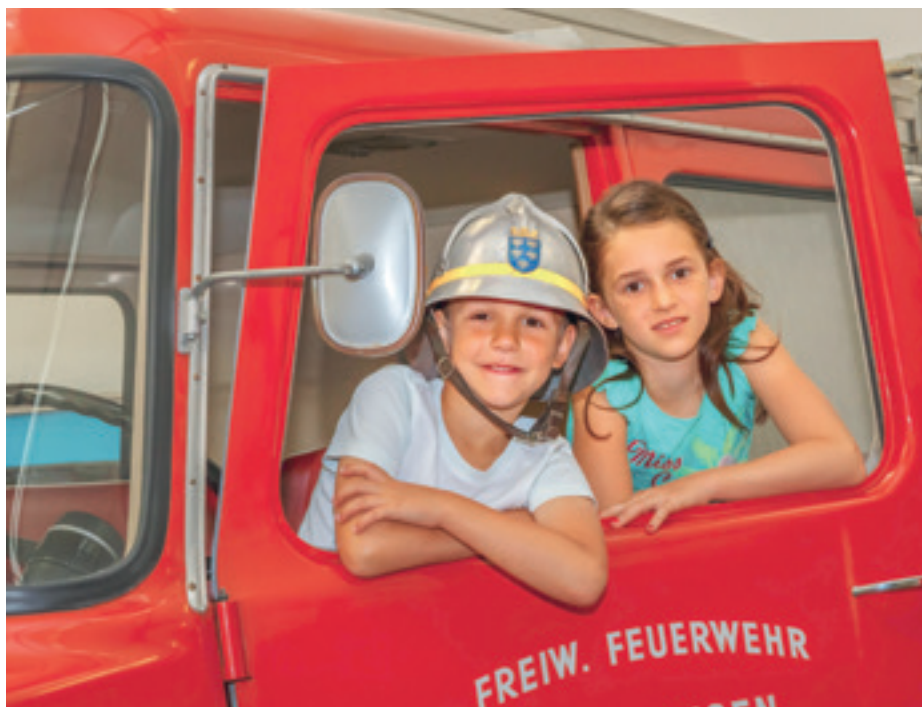
„Feuer & Flamme“ im Stadtmuseum Traiskirchen.

Figuren der Bauherr Hieronymus Übelbacher in Kirche, Kreuzgang und Krypta verwendet hat. Im Benediktinerstift Altenburg , bekannt für seine vom Südtiroler Barockmaler Paul Troger gemalten, prachtvollen Fresken, können Kinder an jedem letzten Sonntag im Monat Leben und Werkstatt eines barocken Künstlers kennenlernen, Bücher selbst herstellen und gestalten sowie Kräuter aus dem Klostersgarten pflücken und Kräutersackerl zusammensetzen.