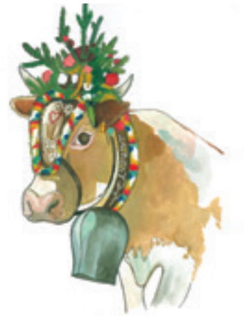
Almabtrieb im September – die Leitkuh wird aufwändig mit Reisig, Blumen und Krepppapier geschmückt.

zel wurden in Blätter eingewickelt und von Helfern mit Kraxen oder Buckelkörben ins Tal gebracht. Käsen und Geschirrwaschen waren die nächsten Tätigkeiten. Die Milchgefäße und der kupferne Käsekessel wurden, auf Hochglanz poliert, an der Außenwand zum Trocknen aufgehängt. Nach dem einfachen Mittagessen bekamen die Schweine Futter. Von drei bis fünf Uhr Nachmittag war wieder Zeit zum Melken.