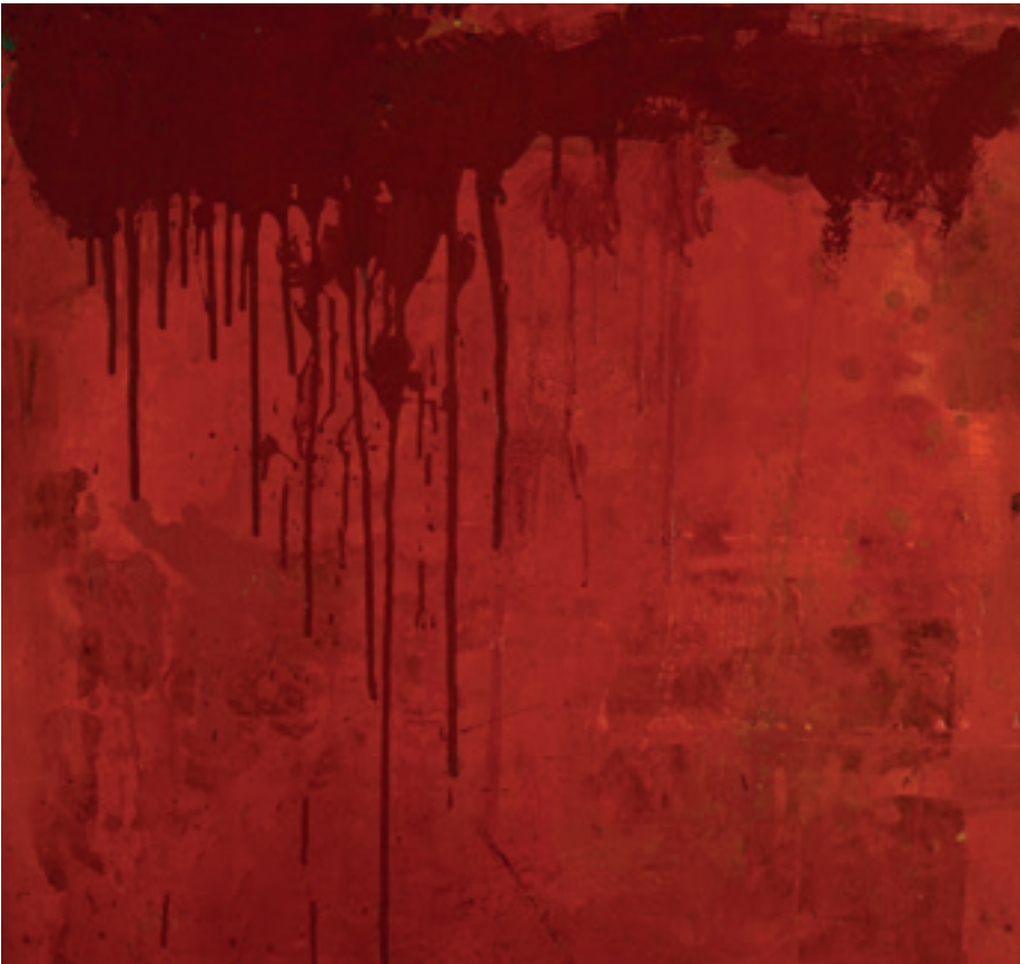
Hermann Nitsch, Opus I , 1960, 71 x 65 cm (Detail).

Können Sie erklären, was ein Schüttbild ist? Was ist die Idee dahinter?