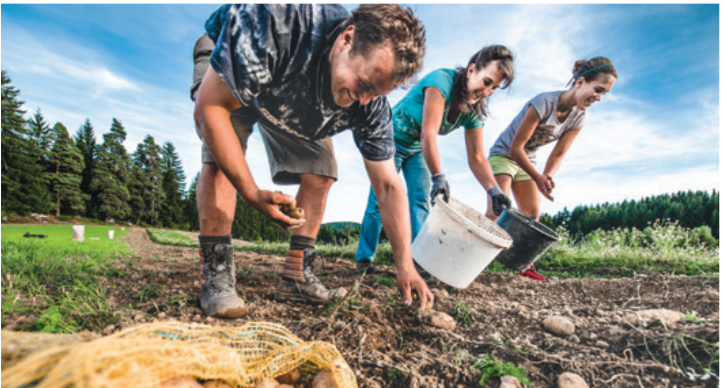
Erdäpfel gehören zu den bekanntesten und vielfältigsten Vertretern aus der Familie der Nachtschattengewächse.

Ein Schwerpunkt beim „Natur im Garten“ Fest am 1. September im Museumsdorf Niedersulz ist dem Thema „Erdäpfel – Vielfalt im Weinviertel“ gewidmet.