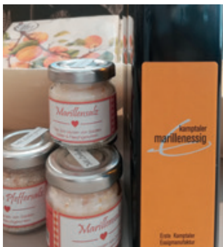
Aus der ersten Kamptaler Essigmanufaktur stammt der Marillenessig, Marillensalz eignet sich zum Würzen von Salaten, Saucen und Fleischgerichten.