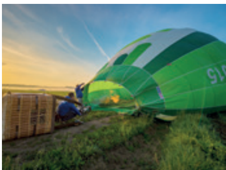
Dem Aufrichten des Ballons ...