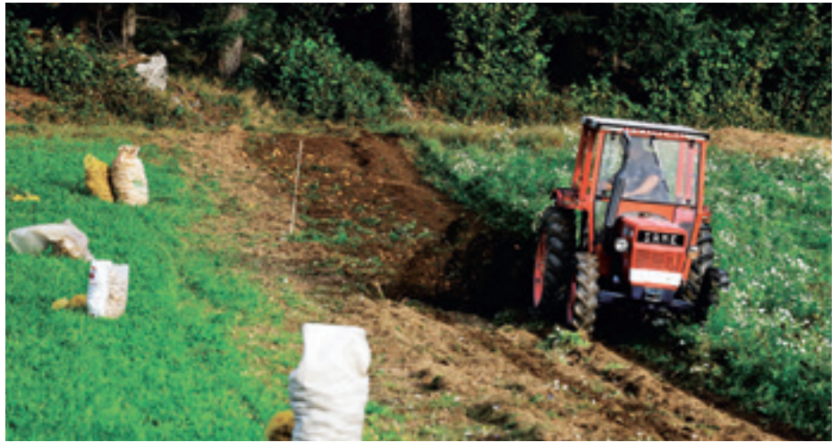
Erdäpfelernte – die ersten Heurigen werden bereits im Juni aus dem Boden geholt.