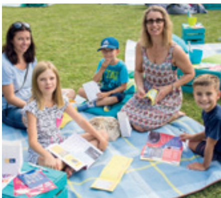
Die Leseinitiative Zeit Punkt Lesen lädt auch heuer wieder zu Lesepicknicks, um gemeinsame Lesemomente im Familienalltag zu verankern.

Während des Schuljahres bleibt oft nur wenig Zeit, um gemeinsam zu lesen. Daher bietet sich gerade der Sommer mit seinen langen Tagen an, um das Lesen zum Erlebnis für die ganze Familie zu machen.