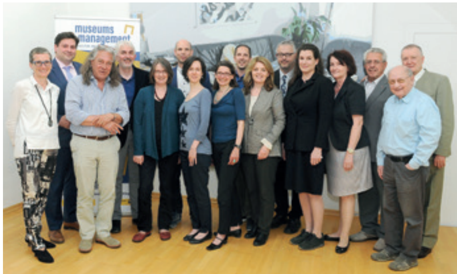
Projektteam und Kooperationspartner: Die Auftaktveranstaltung des Projekts „MuseumsMenschen“ am 3. Mai 2018 im Stadtmuseum St. Pölten.

Unterstützung der Städte. Die Gründung der Stadtmuseen fällt darüber hinaus mit einer Zunahme der Bevölkerung und Verbesserung der Infrastruktur sowie dem Ausbau industrieller Zweige und Verkehrsverbindungen in den betreffenden niederösterreichischen Städten zusammen. Auch die Sammlungen, die nun angelegt wurden, belegen das aufkommende Selbstbewusstsein und das damit verbundene Repräsentationsbedürfnis des Bürgertums. Die Sammlungsschwerpunkte verlegten sich auf die Stadt- und Regionalgeschichte, auf volkskundliche Sammlungen von Arbeitsgeräten und Kunsthandwerk sowie auf archäologische Funde aus der näheren Umgebung.