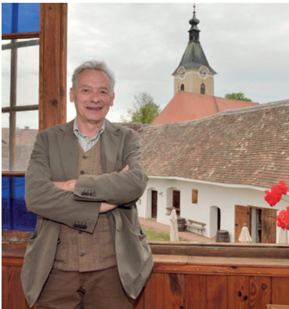
Gute Nachbarschaft – der Dramaturg und Autor Felix Mitterer am Brandlhof.

Zum 70. Geburtstag Felix Mitterers gestaltet die Bühne Weinviertel im Brandlhof einen Abend mit dem Autor und Dramatiker. Das Schaufenster Kultur.Region bringt Auszüge aus der kürzlich erschienenen Autobiografie – über die Übersiedlung von Irland ins Weinviertel und die Begegnungen im Brandlhof.