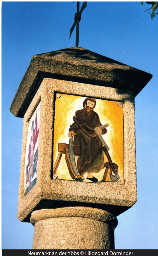
Neumarkt an der Ybbs

Da Nährvater Josef von Beruf Zimmermann war, sind seine Werkzeuge vielfach an christlichen Darstellungen zu finden. Er ist auch der Patron der Zimmerer und nach wie vor wird der Josefitag (19. März) als besonderer Feiertag dieser Berufsgruppe gefeiert.