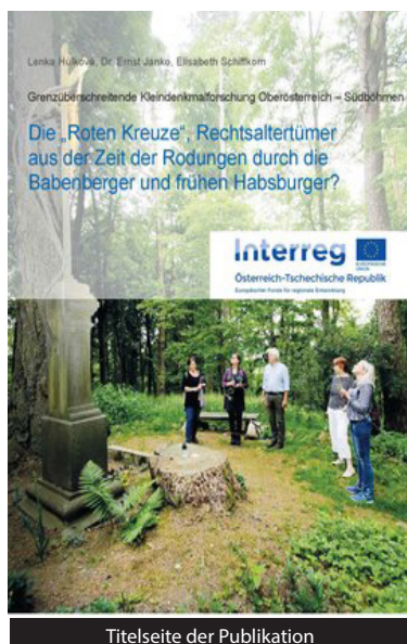
Titelseite der Publikation

Einleitend wird ein Überblick über die verschiedenen Deutungsversuche von Roten Kreuzen geboten sowie eine historische Einbettung in die Herrschaftszeit der Babenberger (10.-13. Jahrhundert) unter besonderer Berücksichtigung der Zeit der Rodungen.