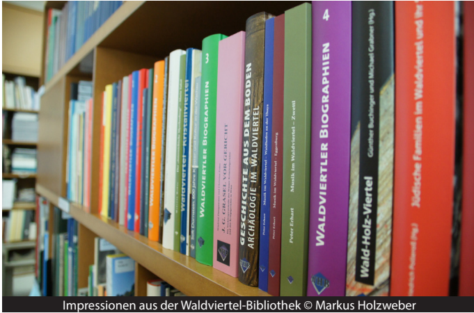
Impressionen aus der Waldviertel-Bibliothek

Die Digitalisierung hat längst den Bereich der Heimatforschung erreicht. Eine Vielzahl an Recherchemöglichkeiten steht uns allen – zum Teil kostenfrei – zur Verfügung. Hervorzuheben seien etwa MatriculaOnline (für Kirchenbücher), der Verein Familia Austria (Datenbanken für Ahnen- und Familienforscher), Anno (für historische Zeitungen) oder Transkribus (KI zum „Übersetzen“ der Kurrentschrift).