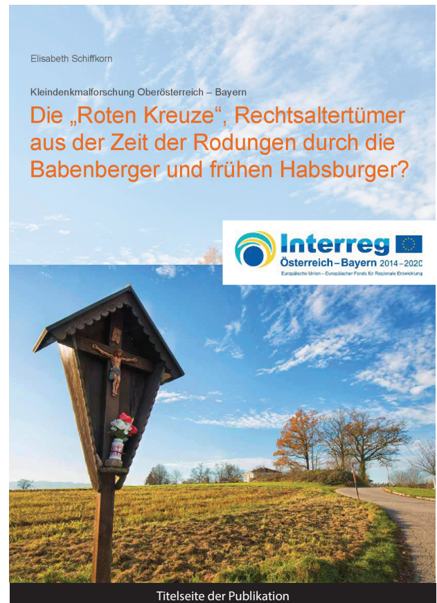
Titelseite der Publikation

Begrüßenswert sind die vielen Verweise auf Rote Kreuze in Niederösterreich, wodurch zum vergleichenden Lesen und Forschen ermuntert wird. So versteht sich die Dokumentation keinesfalls als abgeschlossen: Auch weiterhin freut sich die Forschungsgruppe über Informationen zu Roten Kreuzen!