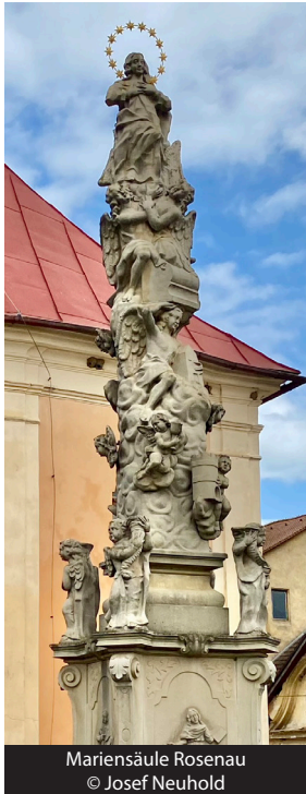
Mariensäule Rosenau