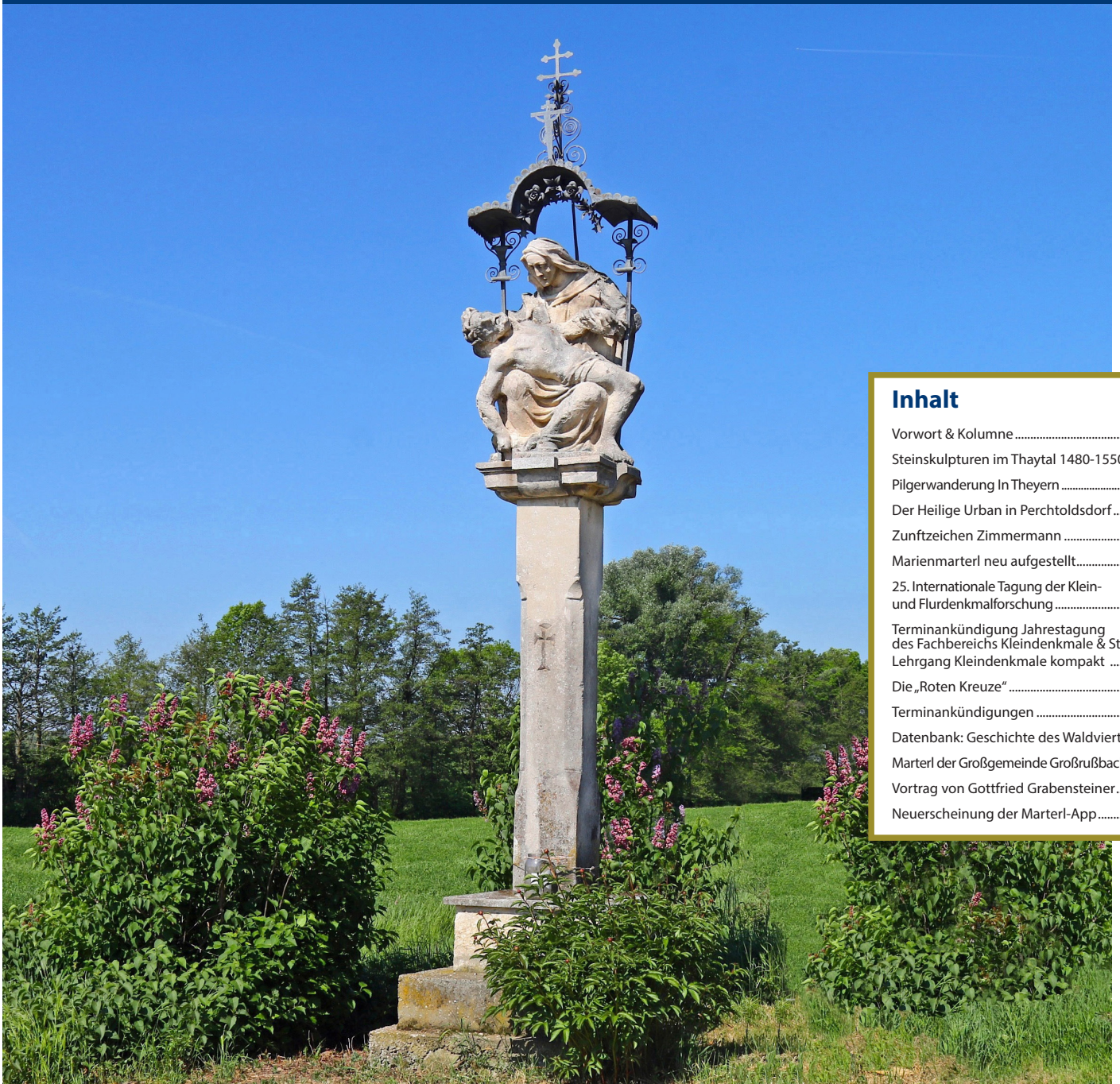
Pietà in Zellerndorf © Alexander Szep