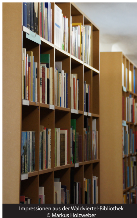
Impressionen aus der Waldviertel-Bibliothek

Adresse: Museum Horn, 3580 Horn, Wiener Straße 4.