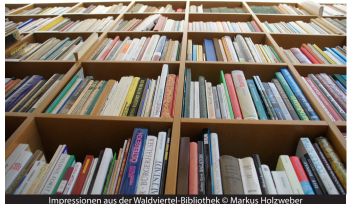
Impressionen aus der Waldviertel-Bibliothek

Im Bereich der Digitalisierung war der Verein bereits früh aktiv. Ein Generalregister der Zeitschrift gab es anfangs noch auf Disketten, die mit der Post verschickt wurden. Später wurden Ausgaben der Zeitschrift ab 1927 bis 1995 bzw. ausgewählte (vergriffene) Bände der Schriftenreihe digitalisiert und kostenlos über die Website zur Verfügung gestellt. Allerdings, die Bibliotheksbestände waren nur lokal in der Waldviertelbibliothek in Horn einzusehen, eine Online-Recherchemöglichkeit gab es nicht. Auch die Artikelsuche und die digitalisierten Bestände waren wenig benutzerfreundlich auf zwei unterschiedliche Websites verteilt.