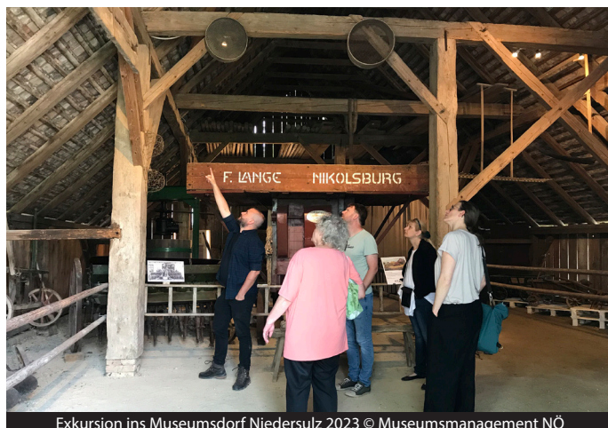
Exkursion ins Museumsdorf Niedersulz 2023

Neu im Programm sind Themen wie der Umgang mit zeitgeschichtlichen bzw. modernen Quellen, das Erkennen von Wappen, Heiligendarstellungen und Hauszeichen wie auch die Recherche und Nachforschung zu (jüdischer) Alltagsgeschichte. Aber auch Exkursionen, beispielsweise durch Krems mit seinem Stadtmuseum, ins Niederösterreichische Landesarchiv und das Diözesanarchiv, sowie die allzeit beliebten Kurrent-Lesekurse für Anfänger und Fortgeschrittene werden angeboten. Natürlich sind alle Kurse auf noemuseen.at einzeln buchbar.