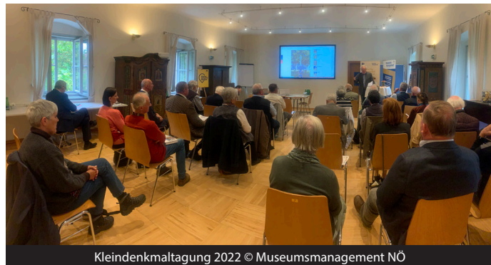
Kleindenkmaltagung 2022

Willkommen sind bei diesem Termin alle, die sich für Flurdenkmale interessieren – gerne auch Teilnehmer*innen vergangener Lehrgänge, die mit der „Kleindenkmal-Community“ in Austausch treten möchten. Nähere Informationen folgen.