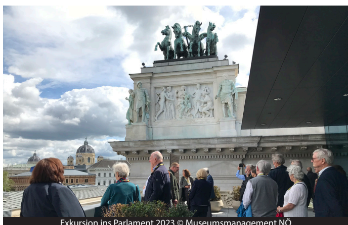
Exkursion ins Parlament 2023

Hochinteressante Exkursionen hat auch der Fachbereich Volkskunde wieder zu bieten: