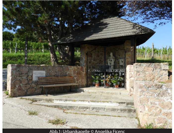
Abb.1: Urbanikapelle

An der Hinterwand der Kapelle steht eine Sandsteinskulptur des heiligen Urbanus, geschaffen von Margarete Hanusch. Der heilige Urban ist mit seinen Attributen Mitra, Bischofsstab und Traube in seinen Händen haltend dargestellt (Abb. 1). Die Statue stellt den französischen Bischof von Langres und Autun dar, der am 23. Jänner 375 n. Chr. verstorben ist. Er ist der Schutzpatron der Weinberge und der Weinbauer.