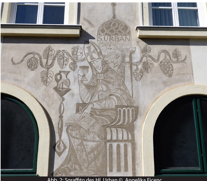
Abb. 2: Sgraffito des Hl. Urban

Der 25. Mai war für die Weinbauern ein wichtiger Lostag. In Österreich, Deutschland und auch Südtirol wurden die geschmückte Statue oder Bilder des hl. Urban I. durch die Weingärten getragen. Wenn die Sonne schien, wurde die Heiligenstatue mit Wein übergossen, bei Regen mit Wasser. In Perchtoldsdorf findet noch heute an diesem Tag eine jährliche Bittprozession zur Urbanikapelle mit anschließender Feldmesse statt.