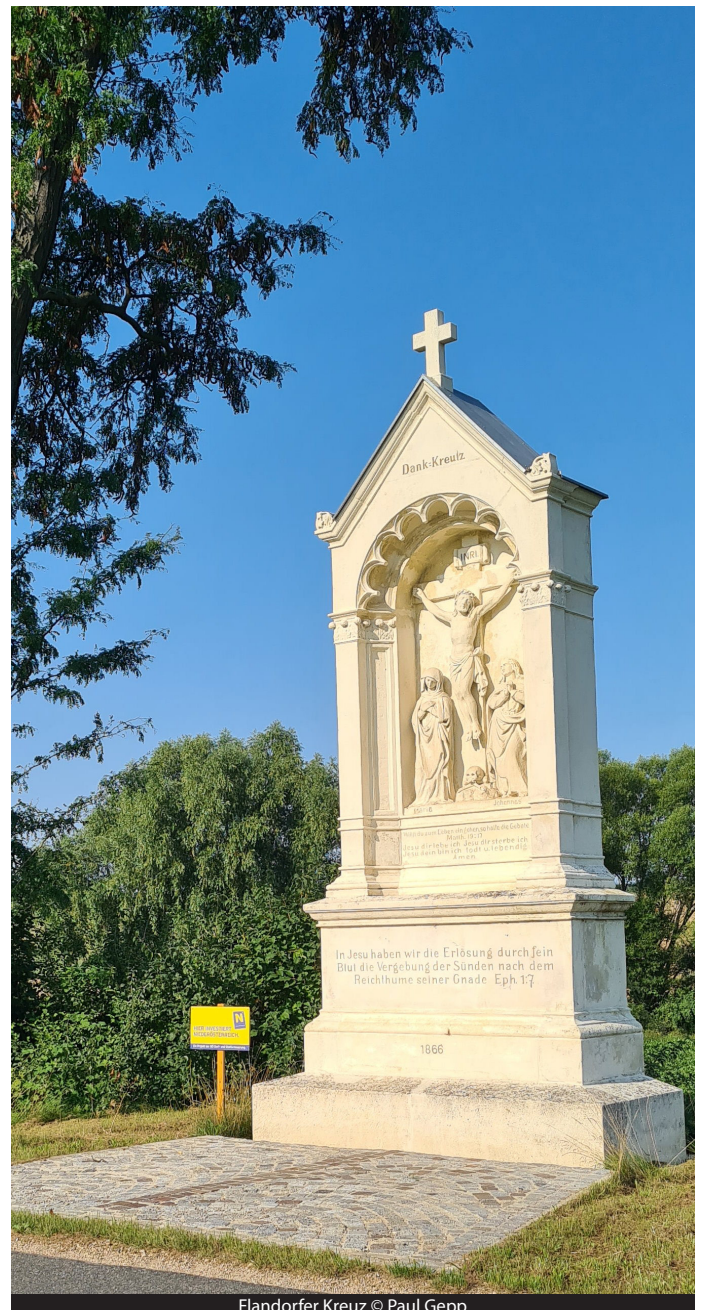
Flandorfer Kreuz

Die Segnung dieser 4 Kreuze wird am Freitag, 2. Juni 2023, vorgenommen.